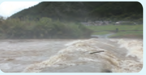
↑増水時の一斗俵沈下橋