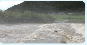
↑ 増水時の一斗俵沈下橋