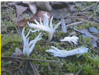
シロヒメホウキタケ