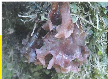
ハナヒラニカワタケ