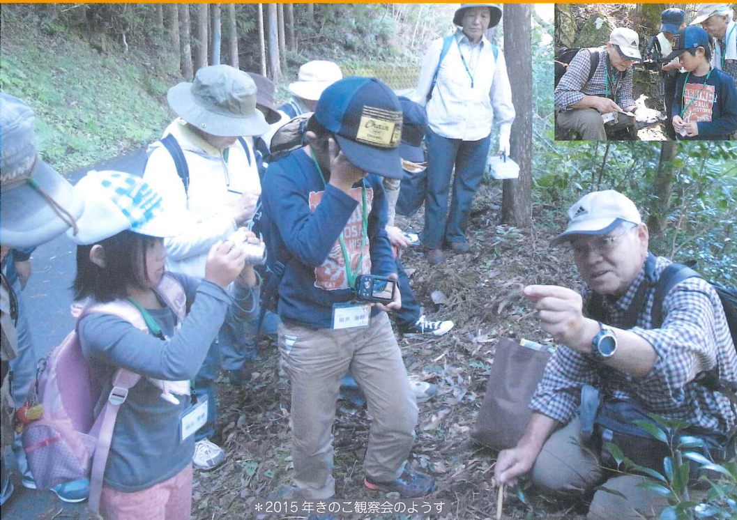
*2015年きのご観察会のような様子